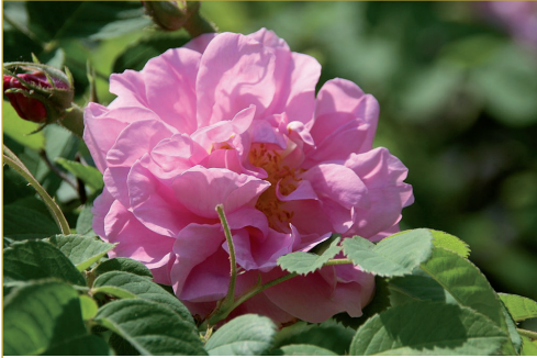
Heckenrose, Rosa damascena